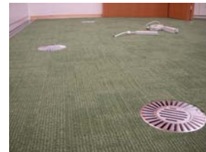
床下吹き出し空調

輻射空調システムとは、熱が物体を介さずに高い温度から低い温度に移行する性質(輻射)を利用して冷暖房を行う空調システムです。